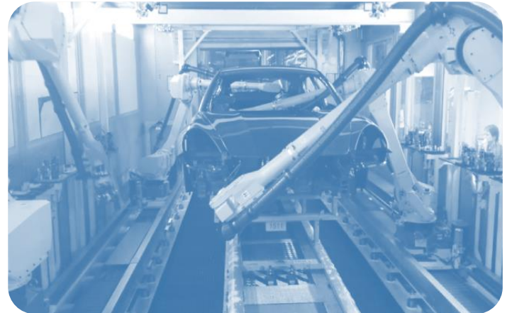
HRK VWNF-HANNOVER 2013